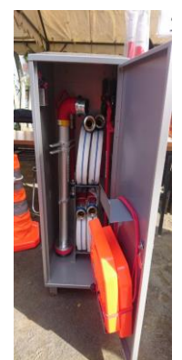
町会で昨年購入の 消火ホースキット